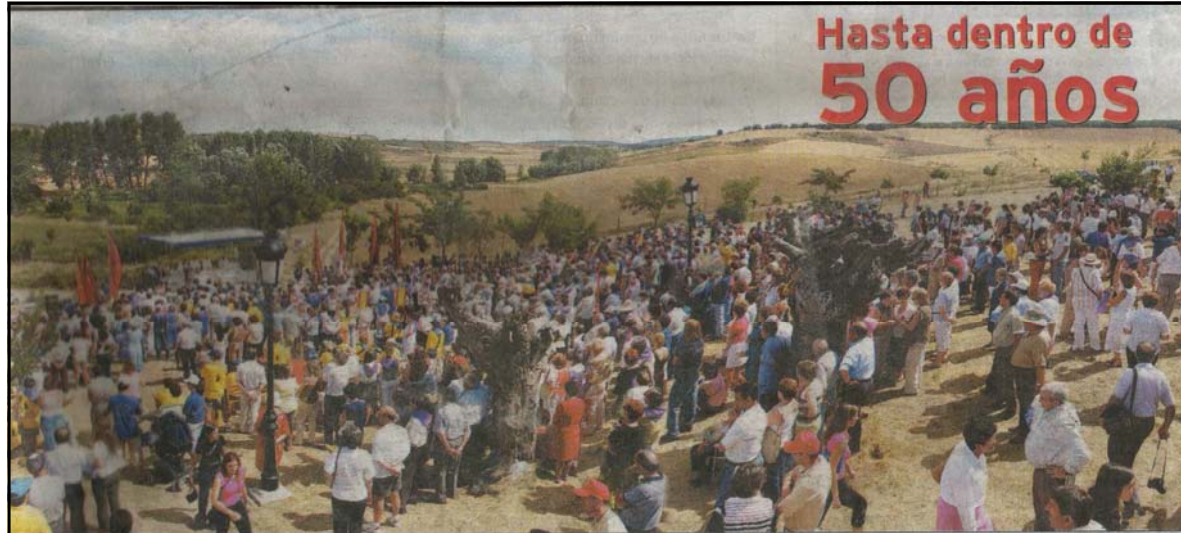
Volvió la Virgen de la Yedra. Más de 3.000 personas volvieron a reunirse ayer en Madrigal del Monte para participar en la Romería de la Virgen de la Yedra, una tradición que únicamente se celebra cada medio siglo. Vecinos de Madrigal, Madrigalejo, Torrecilla, Valdorros, Cogollos Tornadizo, Montuenga y Villamayor salieron en procesión desde sus respectivas localidades para encontrarse en la ermita, donde se celebró una misa. Una gran paellada y diversas actuaciones y juegos populares sirvieron para dar realce a una jornada festiva muy esperada por los lugareños. Sobre todo, porque no volverá a celebrarse hasta 2054.

Este reportaje lo hago desde la ignorancia, con los datos de dos diarios y los comentarios de varios Cejudo implicados. Pido disculpas de antemano a los entendidos en la materia por los errores que pueda cometer a nivel documental y sobre todo por omisión. Dos cosas me han movido para hacer este reportaje, la primera y más importante es que mi madre salió en una de las fotos del Diario de Burgos y la otra es que tenía una página libre en el noticiero de este año. No quiero empezar a hablar de lo que nos ocupa sin antes comprometerme a finalizar este reportaje el año que viene, yo u otra persona documentada que se ofrezca voluntaria.